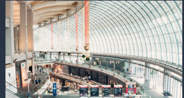
■ NÁKUPNÍ CENTRA A PRODEJNY