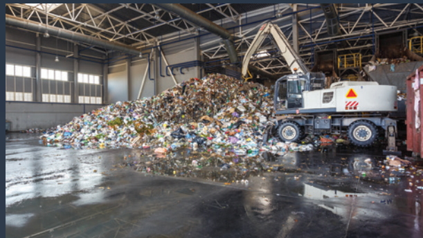
■ RECYKLAČNÍ A ODPADOVÉ HALY