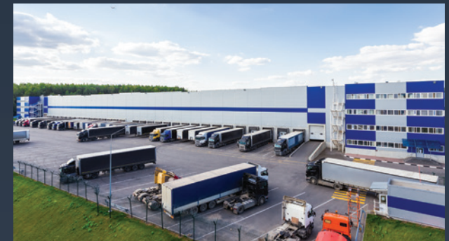
■ LOGISTICKÁ CENTRA