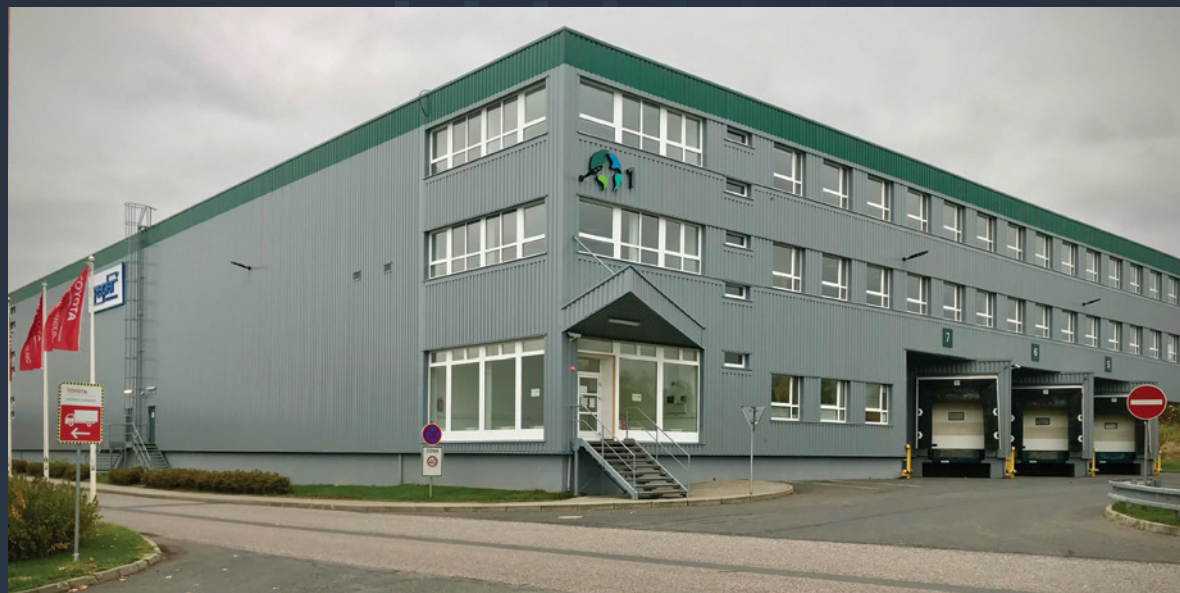
Montáž nového opláštění a klempířských prvků na stávající halu DC1 - Rudná u Prahy