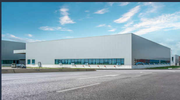
■ SKLADOVÉ HALY