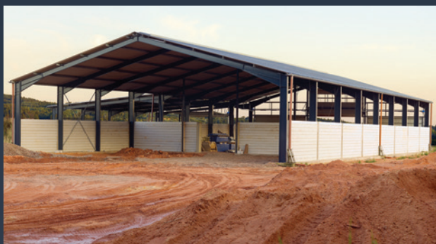
■ ZEMĚDĚLSKÉ STAVBY