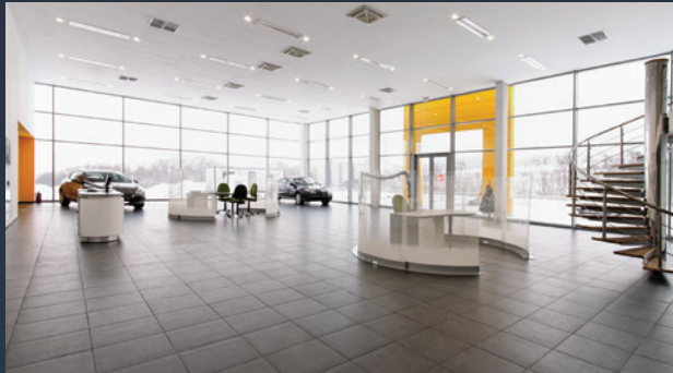
■ AUTOSALONY A SERVISY