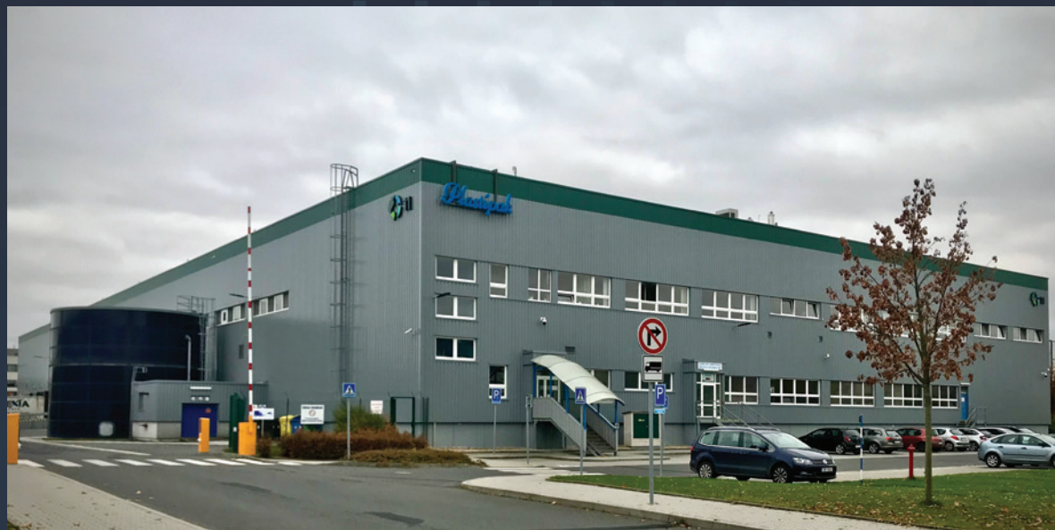
Montáž nového opláštění a klempířských prvků na stávající halu DC11 - Rudná u Prahy