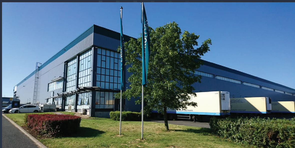
Montáž nového opláštění a klempířských prvků na stávající halu v Jažlovicích