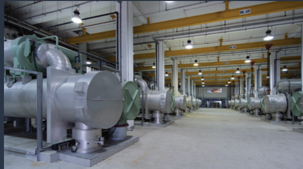
■ CHLADÍRENSKÉ HALY