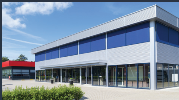
■ ADMINISTRATIVNÍ BUDOVY