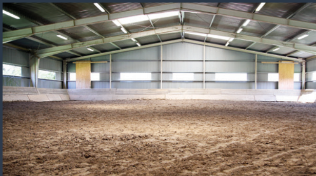
■ JEZDECKÉ HALY