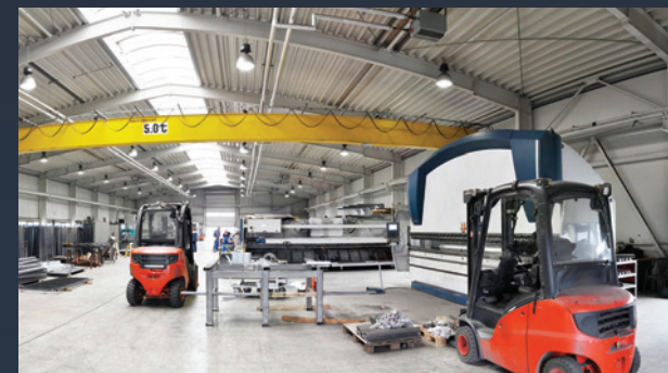
■ VÝROBNÍ HALY