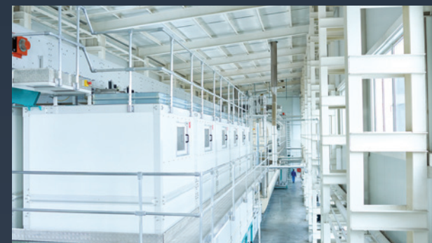
■ POTRAVINÁŘSKÉ HALY