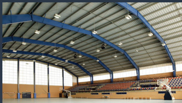
■ SPORTOVNÍ HALY