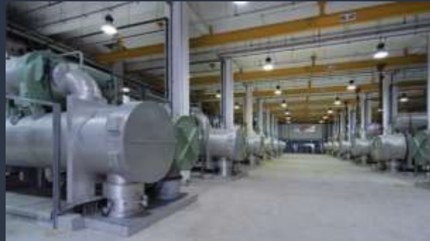
■ CHLADÍRENSKÉ HALY