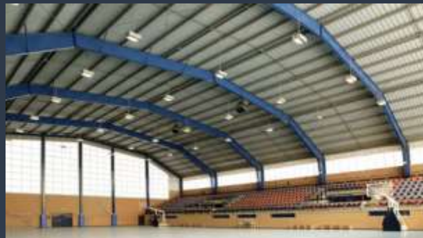
■ SPORTOVNÍ HALY