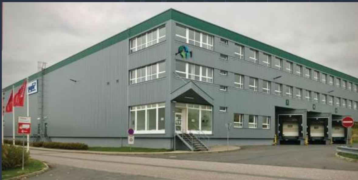
Montáž nového opláštění a klempířských prvků na stávající halu DC1 - Rudná u Prahy