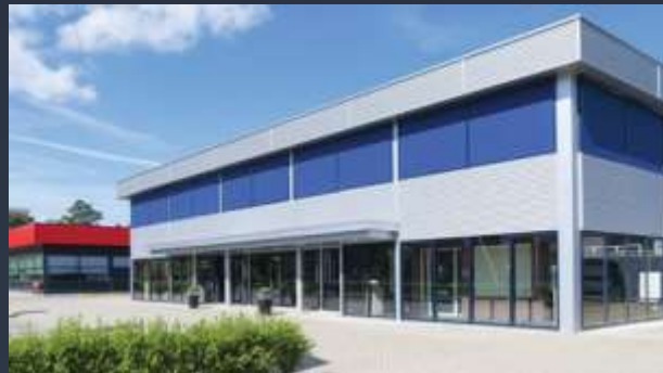
■ ADMINISTRATIVNÍ BUDOVY