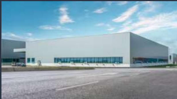
■ SKLADOVÉ HALY