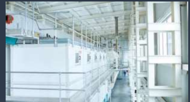
■ POTRAVINÁŘSKÉ HALY