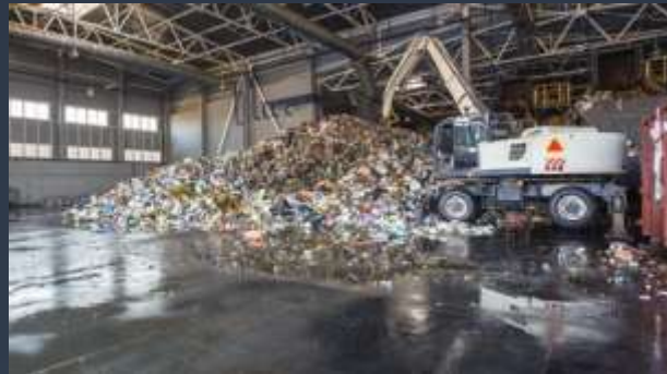
■ RECYKLAČNÍ A ODPADOVÉ HALY