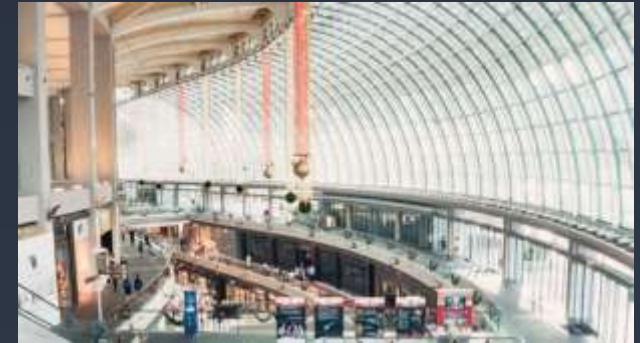
■ NÁKUPNÍ CENTRA A PRODEJNY