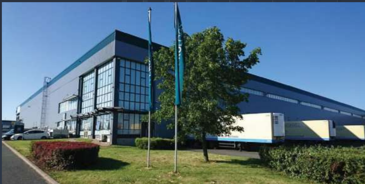
Montáž nového opláštění a klempířských prvků na stávající halu v Jažlovicích