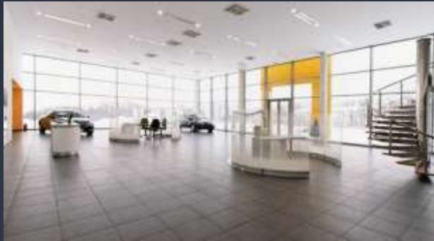
■ AUTOSALONY A SERVISY