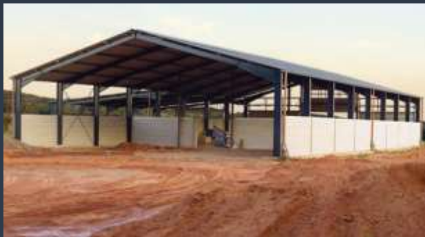
■ ZEMĚDĚLSKÉ STAVBY