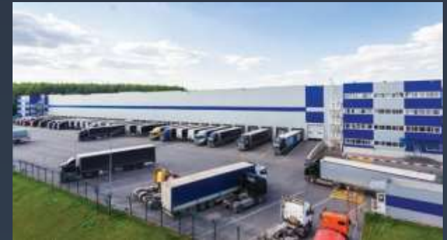
■ LOGISTICKÁ CENTRA