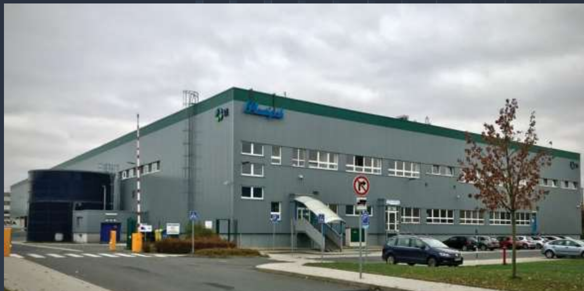
Montáž nového opláštění a klempířských prvků na stávající halu DC11 - Rudná u Prahy