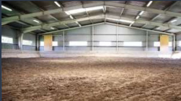
■ JEZDECKÉ HALY