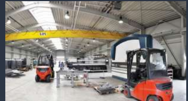
■ VÝROBNÍ HALY